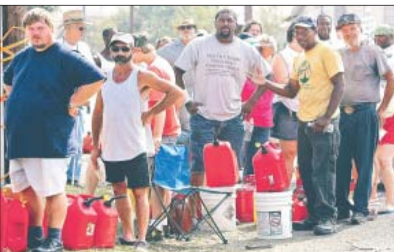
HASTA A PIE. Residentes de la localidad de Poplarville, Misourí, hacen fila durante la mañana de ayer esperando a que abra una gasolinera para abastecerse de combustible.

El anuncio de la AIE permitió una baja del crudo tipo Brent en Londres,