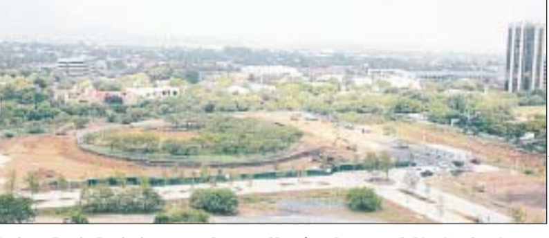
La torre Punto Central -que se desarrollará en la zona delimitada circularmente en la foto- se ubicará detrás de las oficinas de Vitro.

Agregó que para verano del 2007 esperan terminar Punto Central, que estará ubicado detrás de las oficinas de Vitro, por Ricardo Margáin y la Avenida de La Industria, frente al Club Campestre.