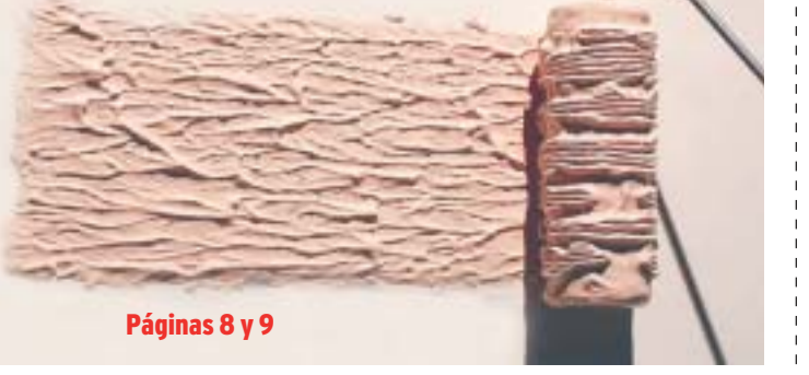
Páginas 8 y 9

Si siente que su casa ha perdido atractivo, darle una manita de gato le ayudará a remodelar su apariencia, además de generarle un mayor valor.