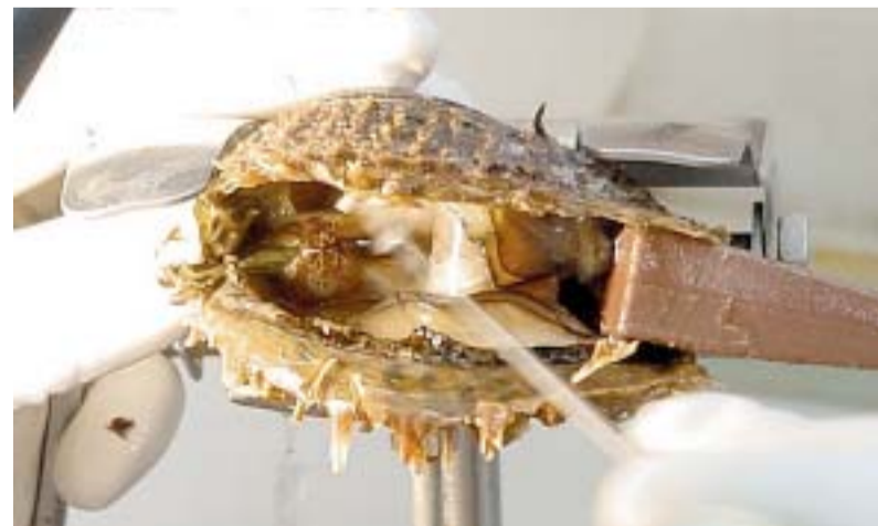
La perla se forma a partir de una partícula que se introduce en la concha. La ostra desvanece el nácar interior para con él cubrir esa partícula hasta formar la perla.

“Nos aprobaron la maestría con investigación y la desarrollamos en