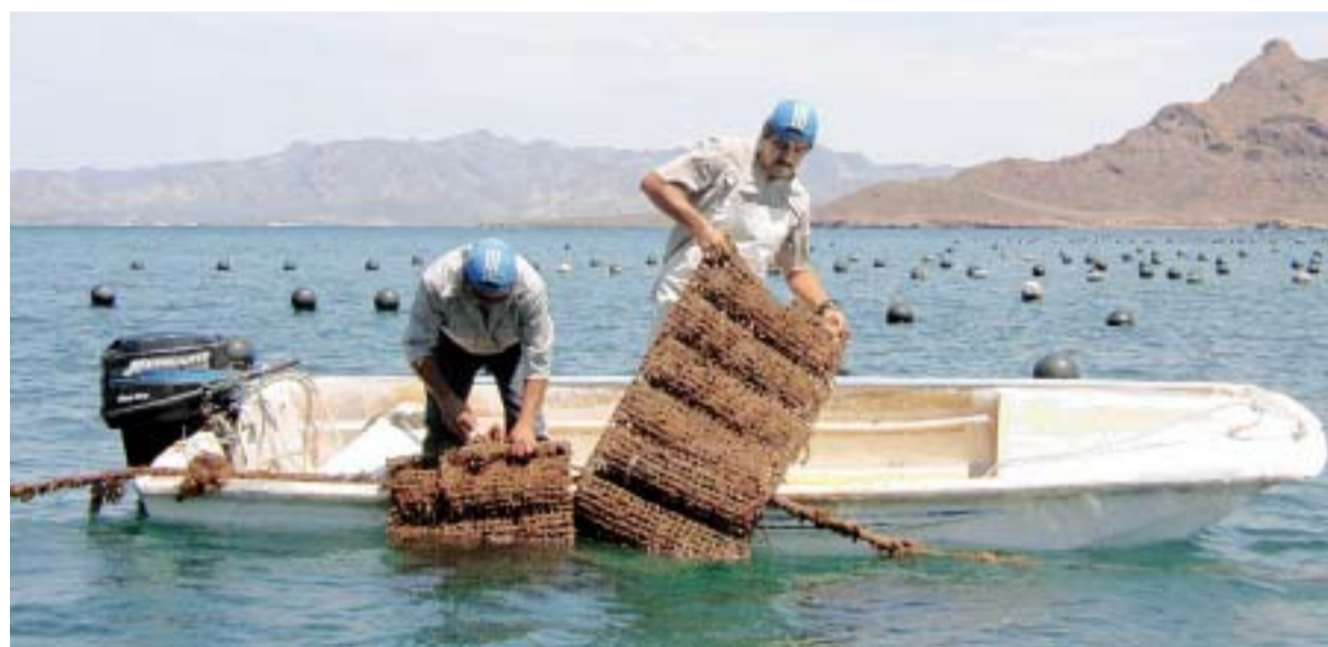
Desde la conquista, las perlas del Mar de Cortés destacaron por su calidad, pero en 1901 debido a la captura ilegal y contaminación, desapareció la producción, hasta 1993.

En materia de comercio exterior, Yesaki refirió que desde el inicio del TLCAN en 1994 y hasta el año pasado, las exportaciones agroalimentarias han venido creciendo a una tasa promedio anual cercana o superior al 10 por ciento.