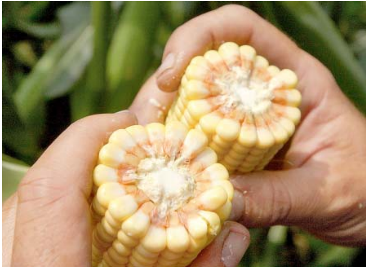
Estados Unidos es uno de los más importantes productores de maíz en el mundo, principalmente del amarillo, que se utiliza de manera masiva en la industria textil y para la producción de forrajes, entre muchos otros usos.